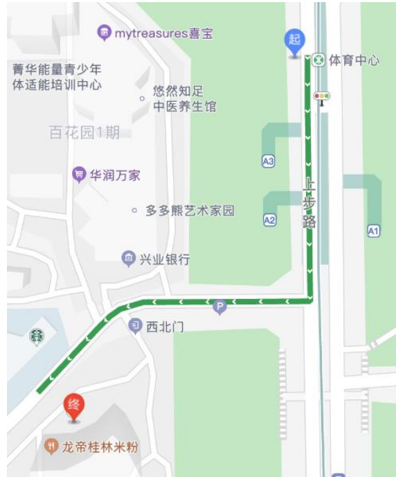
從體育中心站出發