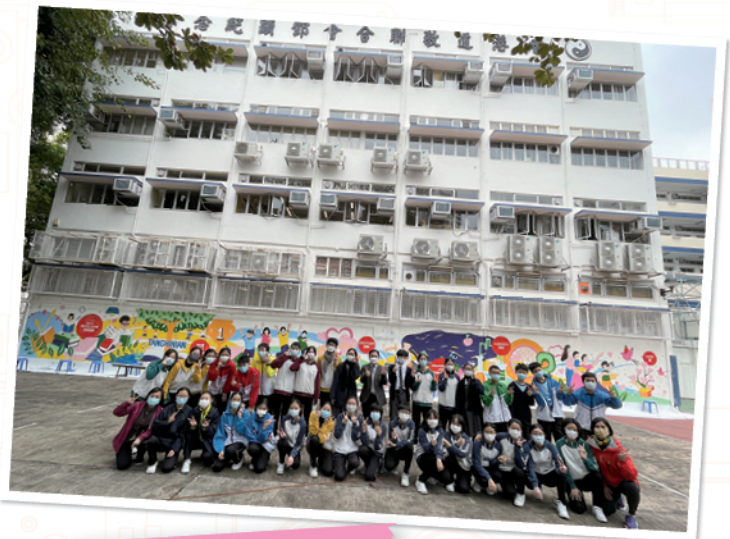
The mural team

"We put on protective suits to prevent our school uniforms from getting stained, and in the meantime, we're wearing masks too — it felt like we were medical personnel!"