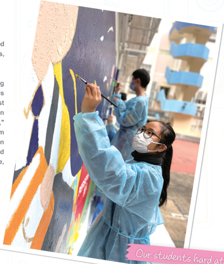
Our students hard at work

The mural creation was an important grounds-beautifying program. It revitalized our campus and has become a novel, iconic landmark of Tanghin. It further presents to onlookers a brand new impression that contrasts with the original school concept focusing primarily on studies. When asked what the school could do in the future, most participants in the project hoped the school could organise more extra-curricular activities for students to decompress from studying and showcase their talents. Some suggested holding a "House Day" for the four houses to arrange creative activities for students and further develop their sense of belonging amongst house members. In addition, committee members from the four houses who participated in the program conveyed their craving for holding school-wide activities to reconnect with house members once the worst of the pandemic has come to an end. One individual stated, "Our Annual P.E. Days and School Picnic were cancelled in the past two years due to Covid, which was indeed disappointing. Fortunately, though, versions of both the School Picnic Day and Sports Days were held as scheduled this year, and today I'm grateful and honored to be here!"