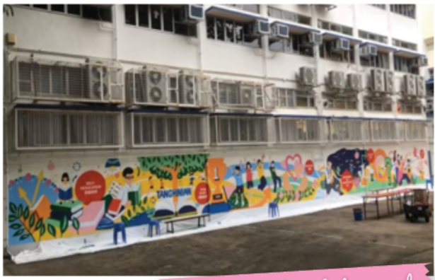
Our new colourful mural

Walking around the campus at recess or after school, have you noticed any changes? The most apparent one must be the multicoloured banner hung on the fence at the football pitch near the school gate, with the school motto "Grasp Principles, Cultivate Virtues" (明道立德). But did you know there is a new artistic wonder at Tanghin?